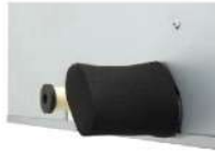
ฝาครอบท่อก๊าซและท่อของเหลว (บรรจุในกล่องพร้อมผลิตภัณฑ์ทั้ง 2 ด้าน)

สามารถเลือกติดตั้งได้ทั้งซ้ายและขวา เมื่อเลือกใช้งานด้านใด ด้านหนึ่งให้ดึงฝาครอบท่อก๊าซ และท่อของเหลวที่ใช้งานด้านนั้นออก จากนั้นให้ถอดแผ่นกันรั่วก่อนทำการเชื่อมต่อ