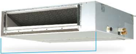
70 cm* *รุ่น FDBF13/18DV2S

ออกแบบคอยล์เย็นให้มีความกว้างที่พอดีกับโถงทางเดินในห้อง