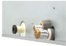
แผ่นกันรั่ว (เพิ่มกับท่อก๊าซและท่อของเหลวทั้ง 4 จุด)

เหมาะสำหรับโรงแรม, คอนโดมิเนียม เลือกเชื่อมต่อได้จากทั้งฝั่งซ้าย และขวา ดีไซน์ที่เน้นความบางและความเรียบ