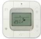
BRC2E61 (รีโมทมีสาย)